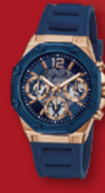
GUESS Momentum ¥26,400 (税込)