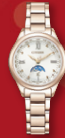
CITIZEN XC daichi ¥91,300 (税込)