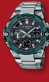
G-SHOCK G-STEEL ¥59,400 (税込)