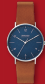
SKAGEN Aaren Naturals ¥19,800 (税込)