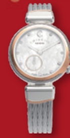
CHARRIOL Celtic ¥198,000 (税込)