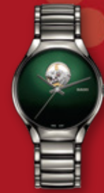
RADO True Secret ¥220,000 (税込)