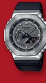
G-SHOCK GM-2100 ¥26,400 (税込)